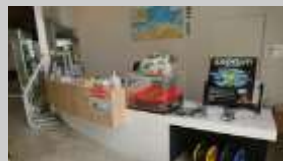
観光案内所等へ設置