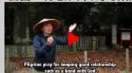
現地ガイドならではのポイントを英語(テロップ、ナレーション)紹介