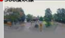
360度カメラ撮影による各スポットの動画で、VRゴーグルを使えばその場所にいるような疑似体験も可能