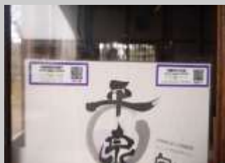
看板への設置(QRコードの貼付)