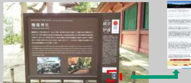
しおがま 鹽竈神社

対象地に訪れた外国人観光客数が平成30年度の約6,400人から令和元年度には約6,700人と増加している。継続して観光客の取り込みに努める。(鹽竈神社へのヒアリング)